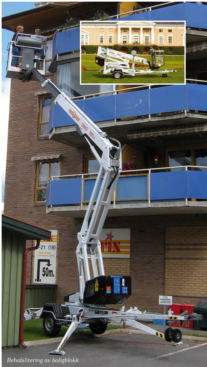
Rehabilitering av boligblokk