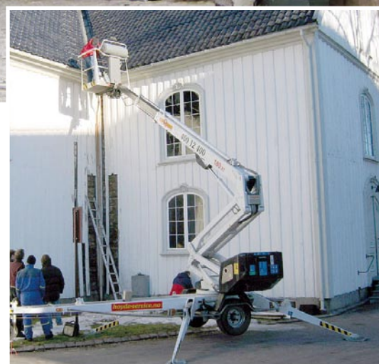
Restaurering, Østsidan kirke Porsgrunn