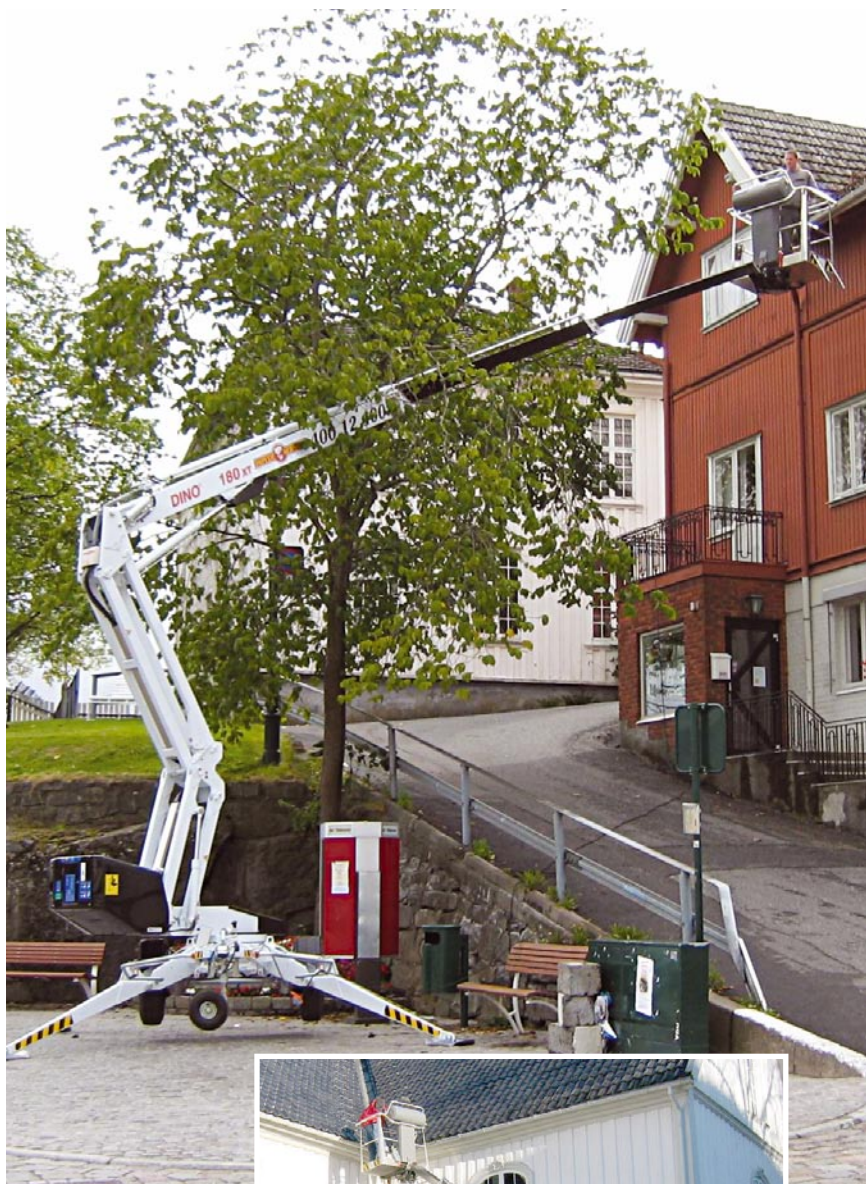
Torvet i Brevik