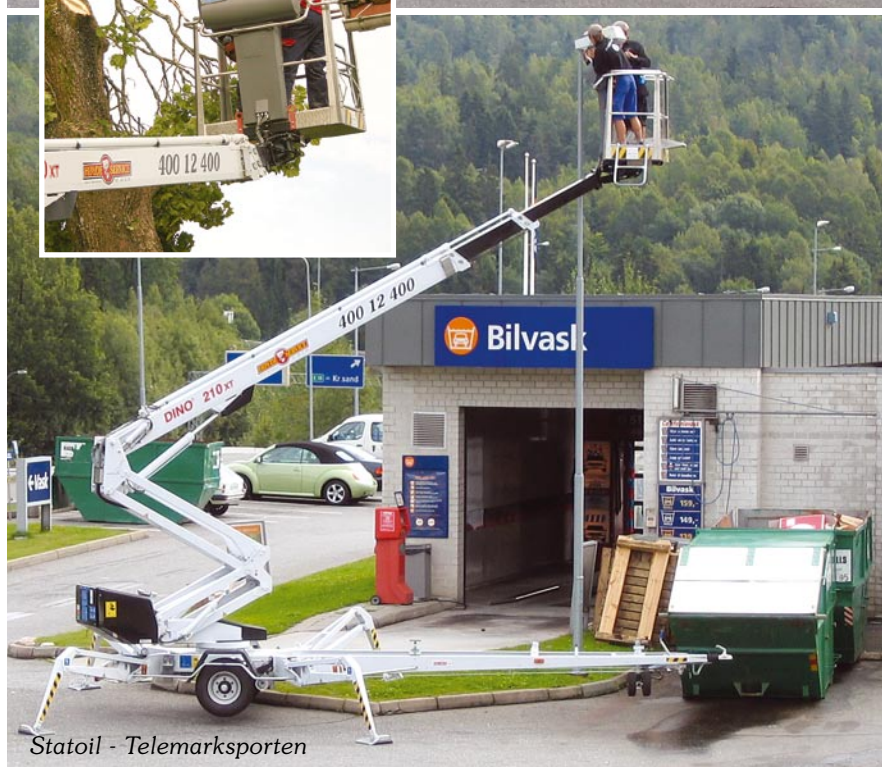
Statoil - Telemarksporten