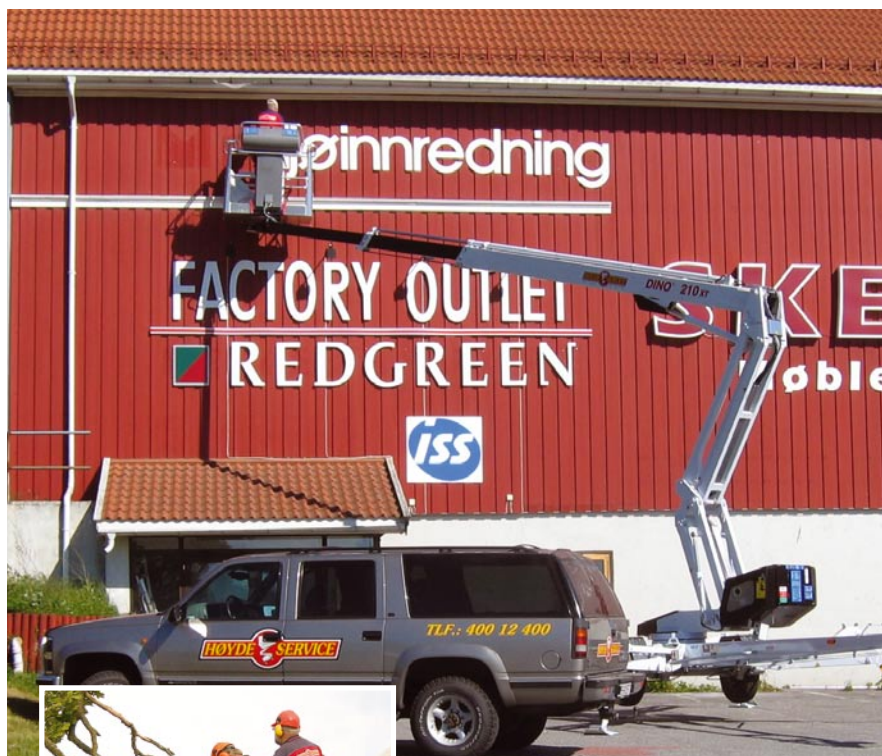
-Skeidar Bommestad i Larvik